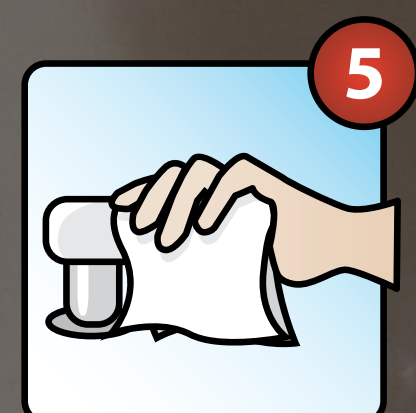
Fermer le robinet avec la serviette