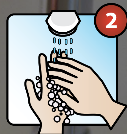
Savonner (20 secondes)