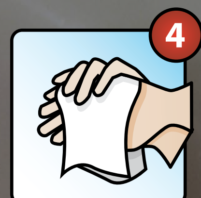
Sécher avec une serviette